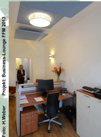
Projekt: Business-Lounge FFM 2013

Lernen Sie die nutzbringende Wirkung von Formen und Farben kennen - ob für das Homeoffice, für ein kleines Einzelbüro, den Arbeitsplatz an einer Empfangstheke oder die komplexen Zusammenhänge im Großraumbüro. Entdecken Sie - unter fachlicher Anleitung - die passende Lösung für Ihren Arbeitsplatz ... und gestalten Sie ihn.