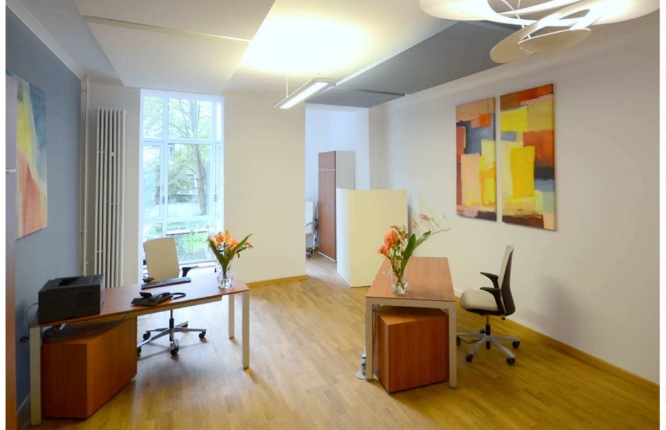
Projekt: Businesssetze mit Feng Shui Frankfurt/Westend 2013

News & Projekte finden Sie auf: www.modern-life-design.com