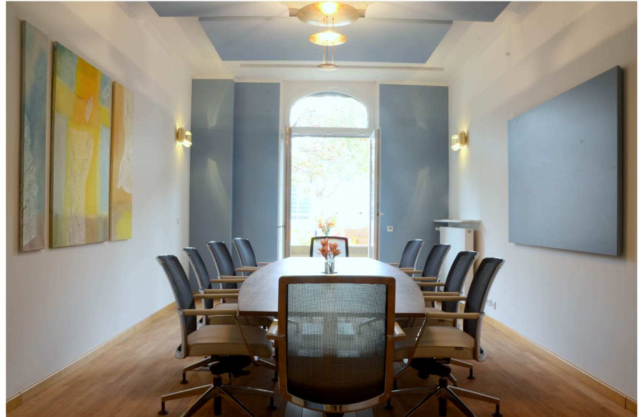
Projekt: Businessetage mit Feng Shui Frankfurt/Westend 2013

News & Projekte finden Sie auf: www.modern-life-design.com