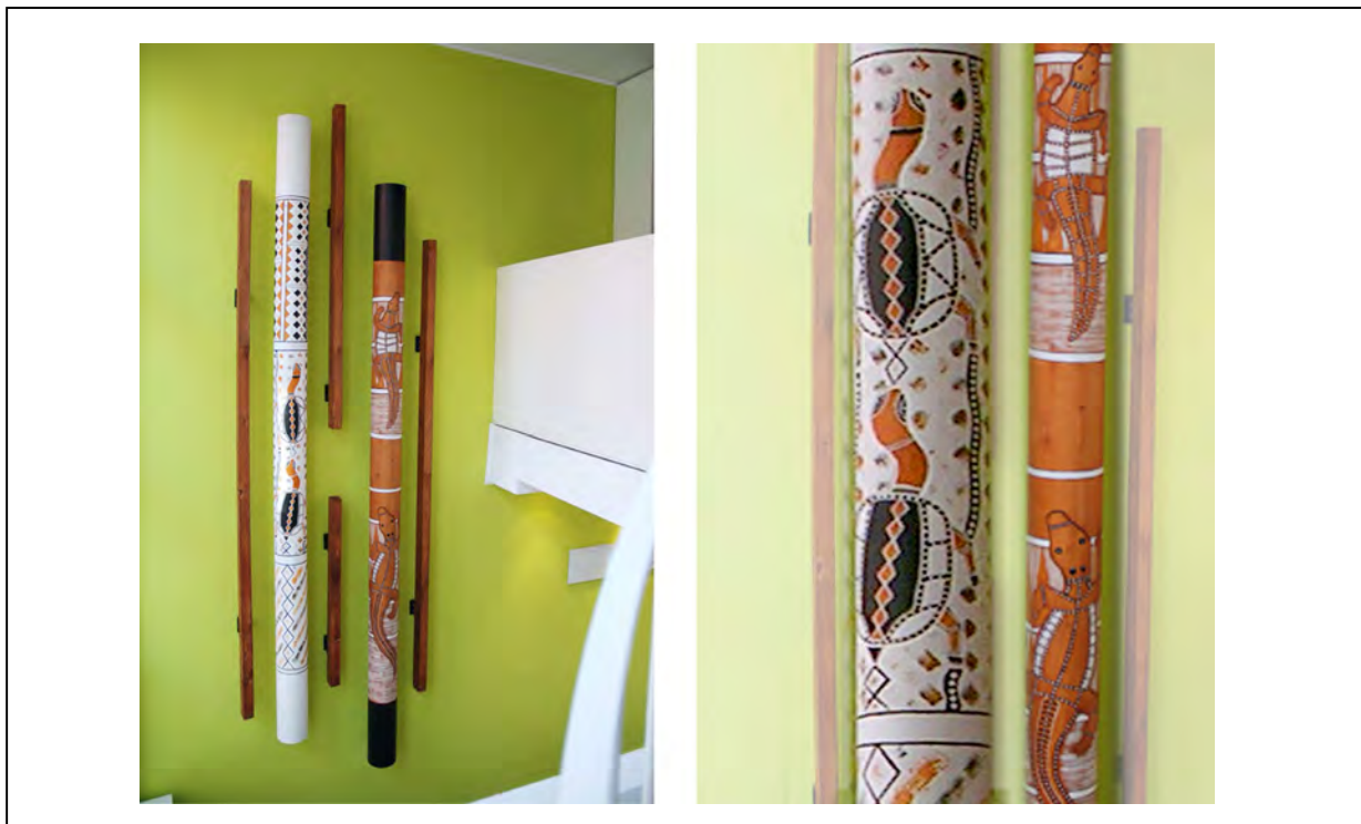
Abb. 16 Skulptur für Boyden Geschäftshaus in Bad Homburg

Die Intensität von Schöнем liegt bei: 10.000 bis 13.500 Boviseinheiten Liegen Räume höherer Intensität bei Messwerten von 10.000 bis 13.500 Boviseinheiten, haben sie eine Wirkung auf die Seele. Klang, Kunst, Farben und Duft heben die Stimmung und bewirken Heiterkeit. Business-Designs mit "Wow-Effekt", heben die Stimmung.