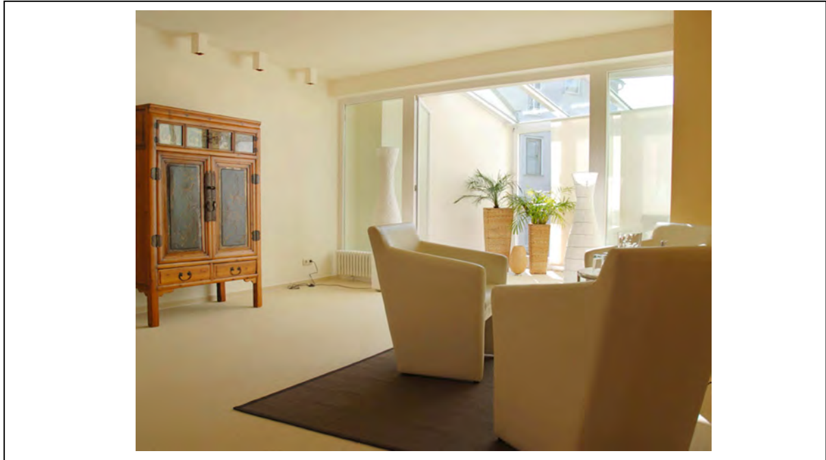
Abb. 9 Praxisambiente - Geschäftshaus Bad Homburg