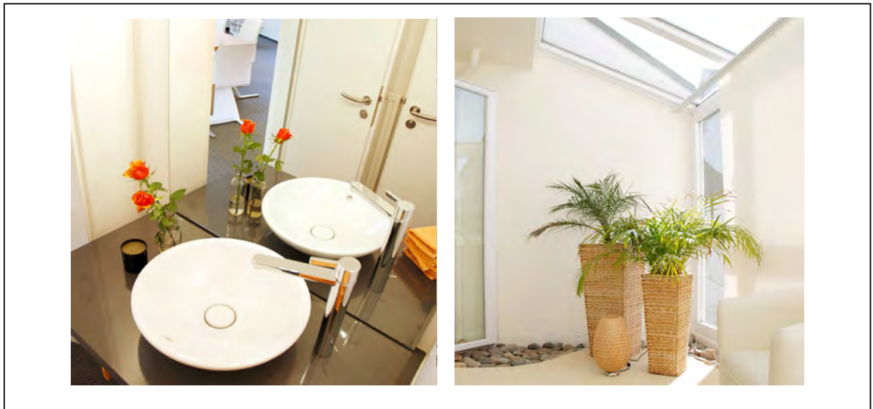
Abb. 13 Das frische Kunden-WC Bürohaus in Bad Homburg

Gesunde, weichblättrige Pflanzen und frische Blumen haben einen gesundheitsfördernden Einfluss auf das menschliche Kraftfeld. Sie bringen erforderliche Vitalenergie in abfließende Bereiche, wie z.B. WC, Bäder. Energie fließt im Bereich von Glasfassaden ab und in gerade, langen Fluren. Hier halten und zirkulieren Pflanzen Energie.