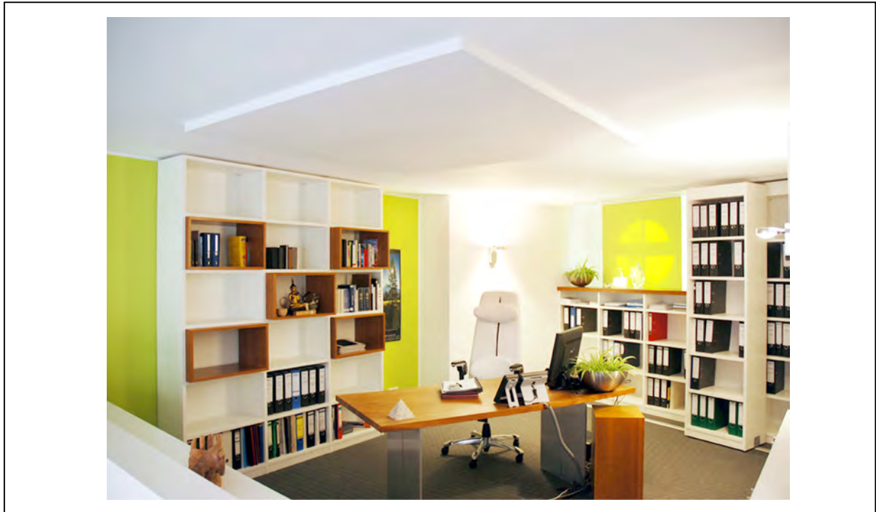
Abb. 15 Modernes Büro-Design - Geschäftshaus Bad Homburg

Harmonisch arrangierte Möbel haben eine positive Wirkung auf die Aura. Das Büro -Abb.12- wird mit einem effizienten und angenehmen Arbeitsstil in Verbindung gebracht. Unordentliche und hässliche Büros kosten zusätzliche Überzeugungsarbeit und Kraft.