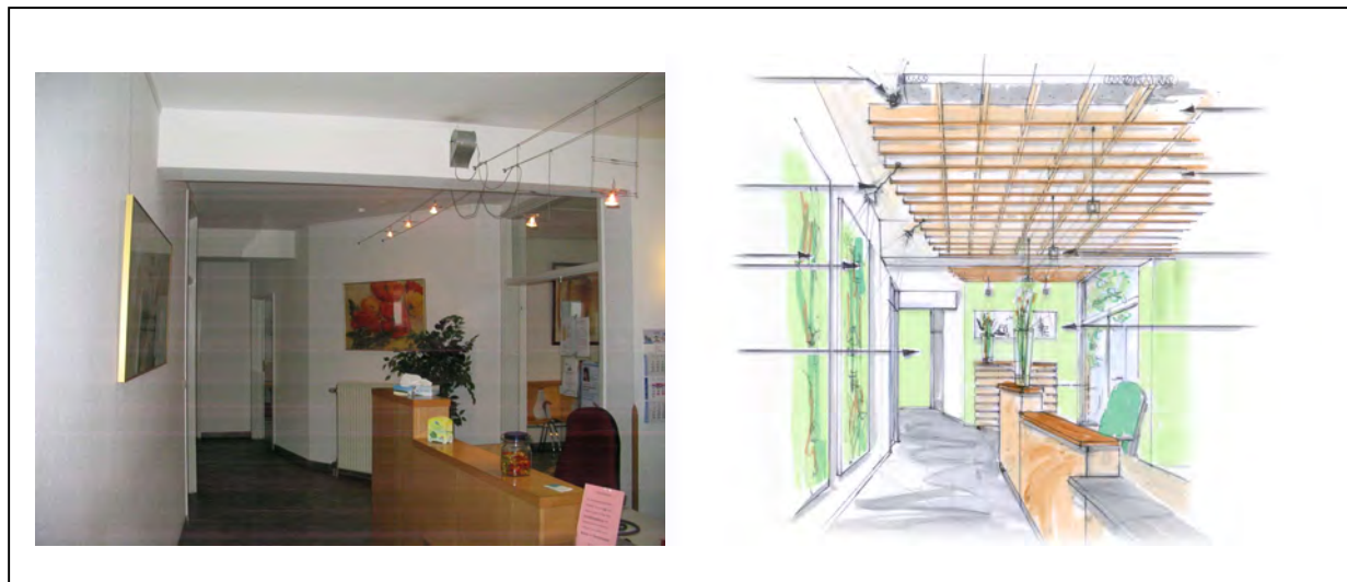
Abb.2 VORHER Praxis-Empfang

"Oh-No" , genervt und frustriert verlässt der Patient das hallig-laute Foyer der Praxis oder ist froh, das Telefonat mit der Arzthelferin schnell abzuhaken. Schuld ist ein schallharter Raum. An den verputzten Wänden, Decken und dem Steinboden reflektiert sich der Schall und hallt lange nach. Der Raum kann seine Funktion als leises Empfangszimmer nicht erfüllen.