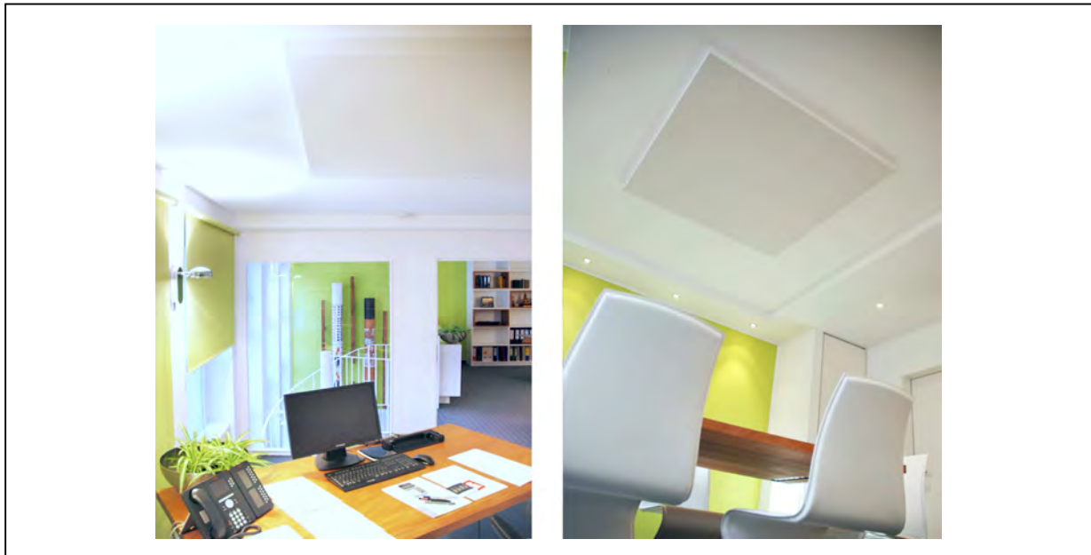
Abb. 17 + 18 Raumakustik als Deckenfeld & farbige Wand Geschäftshaus in Bad Homburg

Abb. 17 und 18 zeigen farbig angelegte akustisch wirksame Wände, kleine Deckenfelder und Teppich. Der 2-geschossige Büroraum ist so angenehm bedämpft.