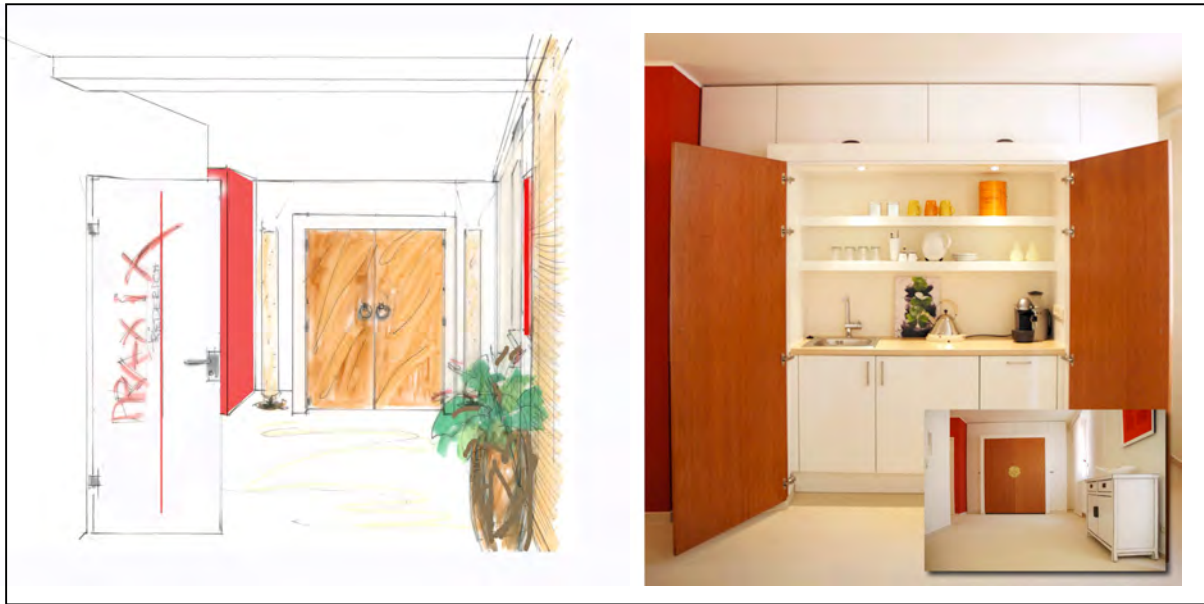
Abb. 7 VISION - Praxis Bad Homburg