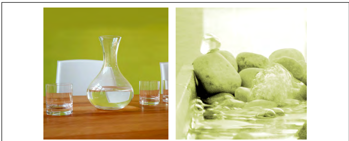
Abb. 19 + 20 Wasser im Business-Design ... vitalisiert Kunde und Umgebung

Die Autorin erwartet mit Spannung die Entwicklung entsprechender Messgeräte, welche z.B. die Einführung eines "Qualitäts- bzw. Gesundheits-Labels" für Businessräume erlauben.