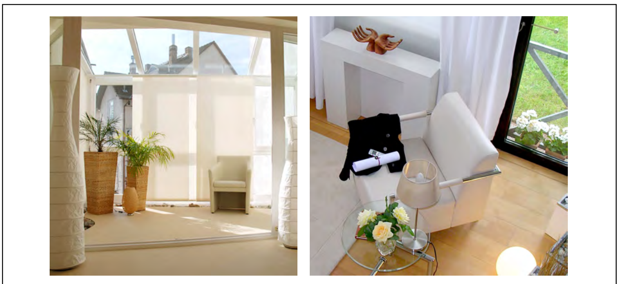
Abb.11 + 12 Wartebereiche rechts: Praxis Bad Homburg links: Büro in Königstein

Wenn "die Chemie stimmt", nehmen wir das energetische Kraftfeld des anderen wahr. Das geschieht bereits im Wartebereich. Der Kunde schwingt sich hier auf das Unternehmen ein.