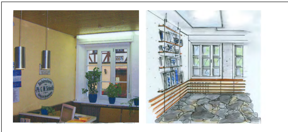
Abb.3 VORHER Verlags-Empfang

Nach der chinesischen traditionellen Gestaltungslehre des Feng Shui ist der Raum Yin-dominiert. Er überstrapaziert die Rezeptivität und Geduld des Kunden.