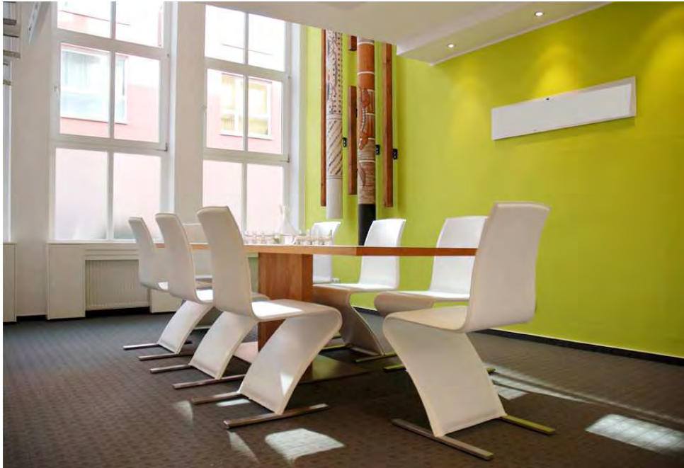
Abb. 1 Modernes Bürodiesign - Geschäftshaus Bad Homburg

"WOW" - der Kunde ist begeistert. Der erste Eindruck hat die Erwartung weit übertroffen und beeinflusst nun seine Entscheidung.